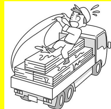
イメージ図

被災者は、荷の積み込み完了後、積荷上で、積荷にシートをかける作業中、何らかの理由で荷台から地上に墜落し、頭部を強打したものです。